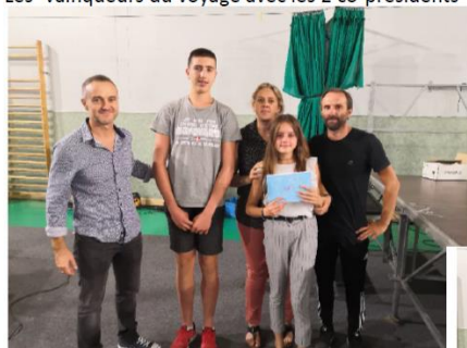
Les Vainqueurs du voyage avec les 2 co-présidents