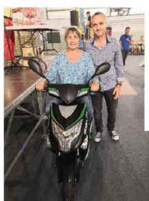
La gagnante du scooter