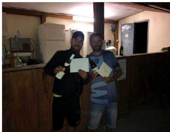
SUPERBE EDITION. MERCİ A TOUS CEUX QUI ONT PREPARE