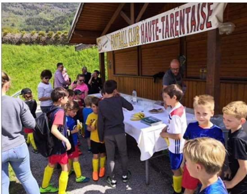
Au cours de la saison, un atelier "Mangeons bien, mangeons sain" a été mis en place avec "La Vie Claire" d'Aime à destination des jeunes enfants.